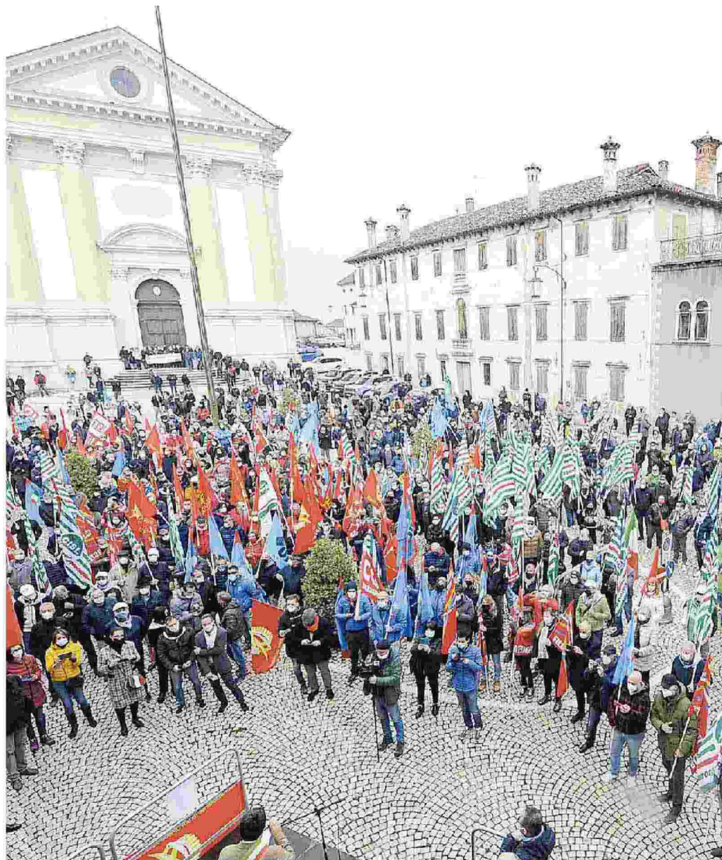
Un momento della manifestazione di sabato scorso a Mel in aiuto di Acc e di Ideal Standard