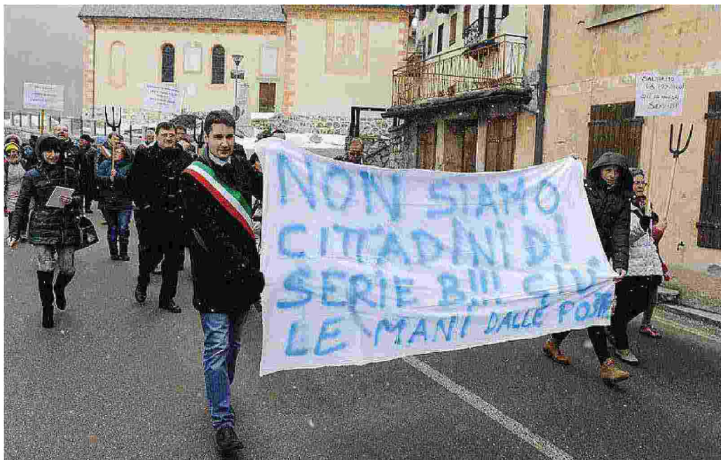
La manifestazione a Zoldo Alto contro la chiusura dell'ufficio postale nel 2015