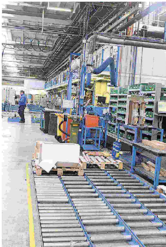
Il brindisi dei vertici di Clivet sancisce il via alla nuova linea produttiva e uno scorcio dello stabilimento Clivet a Villapaiera