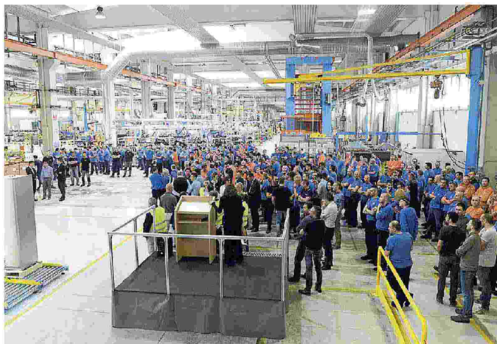
Vertici aziendali, lavoratori e invitati alla cerimonia organizzata in azienda ieri pomeriggio