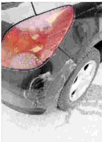
LA SORPRESA Carrozzeria strisciata ieri davanti alla Luxottica

DELL'ATTI (RSU CGIL): «L'AZIENDA NON PUÒ RESTARE SORDA VERSO I TANTI DIPENDENTI DANNEGGIATI»