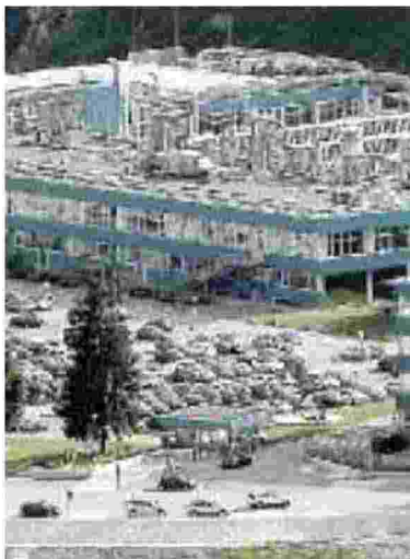
L'INCUBO I dipendenti Luxottica non sanno dove parcheggiare