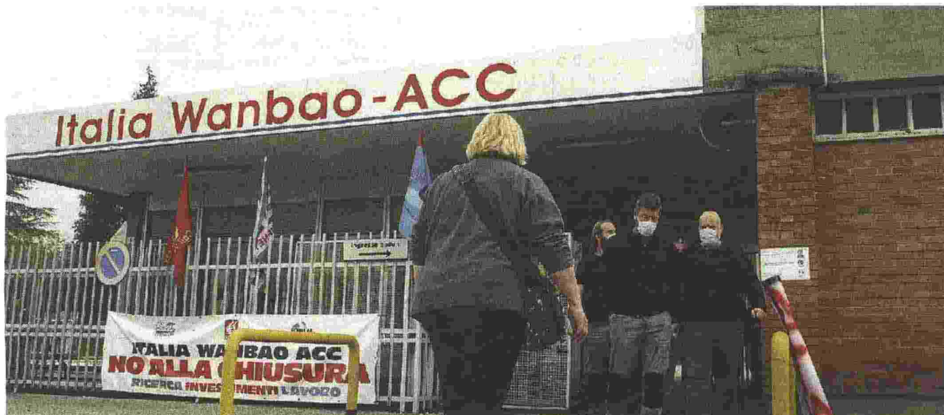
GIORNATE di incontri febbrili per il futuro dell'Acc: oggi in calendario un nuovo vertice in Regione, ieri la visita del prefetto Savastano