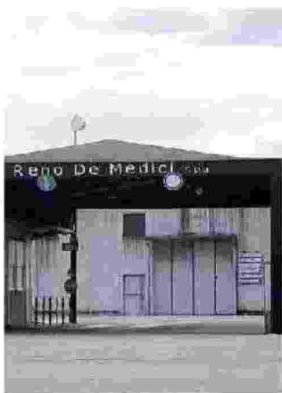
ESTERNO dello stabilimento della cartiera Reno de Medici