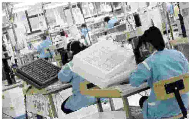
OCCUPAZIONE L'occhialeria non conosce crisi e macina record